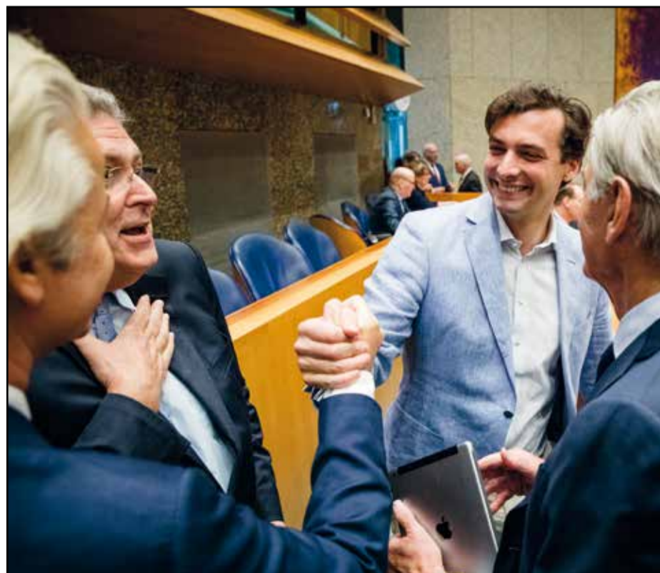
Thierry Baudet wordt gefeliciteerd door andere Kamerleden.

Forum voor Democratie (FvD) is de grote winnaar geworden van de verkiezingen voor de Provinciale Staten. Die werden vorige maand gehouden. De partij van Thierry Baudet kreeg de meeste stemmen. GroenLinks heeft het ook goed gedaan. De PVV, het CDA en D66 verloren. Het FvD heeft niet alleen veel macht in de provincies. Maar krijgt straks ook veel zetels in de Eerste Kamer. Andere partijen moeten dan gaan samenwerken met het FvD. Dat zal niet zo makkelijk gaan. De partij heeft namelijk extreme ideeën, en is het bijna nooit eens met andere partijen. Ook heeft het FvD nog weinig duidelijke plannen voor de provincies.