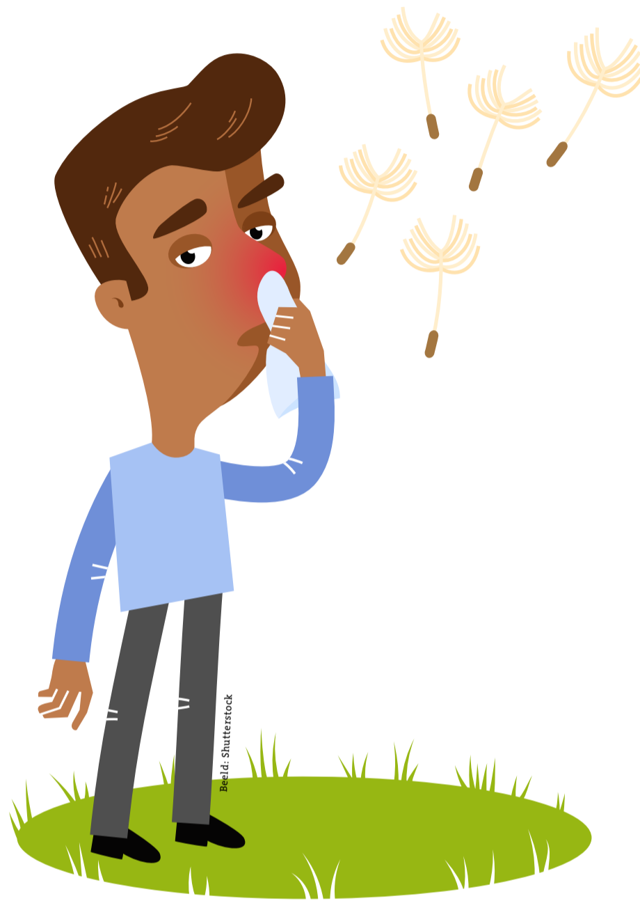
Mensen met hooikoorts zijn allergisch voor pollen.

Op warme, winderige dagen kunnen er miljoenen pollen in de lucht zweven. Komen die terecht op je neusslijmvlies, oogbollen of in je luchtwegen? Dan reageert je lichaam daarop. Je afweersysteem maakt histamine aan. Op zich is dat goed, want dit stofje zorgt