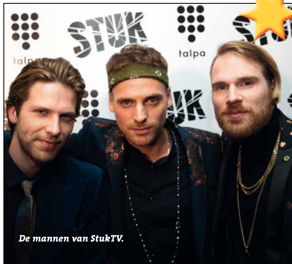
De mannen van StukTV.

Britt Dekker heeft een paard gekregen van John de Mol. De presentatrice gaat een aantal programma's maken voor Talpa, de zender van De Mol. In plaats van salaris vroeg Dekker een paard als betaling. 'En dat was goed', schrijft een dolgelukkige Britt op Instagram. 'John zei tegen mij dat hij heel veel van dieren houdt. Hij heeft mij een vriend voor het leven gegeven: de witte hengst George!'