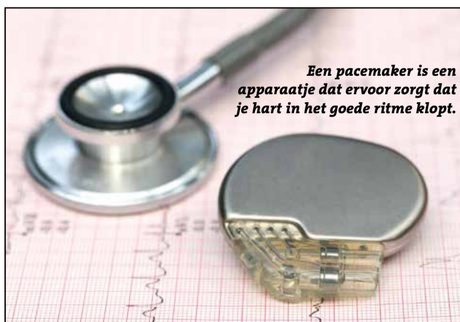
Een pacemaker is een apparaatje dat ervoor zorgt dat je hart in het goede ritme klopt.

Rico merkt weinig van de pacemaker. ‘Ik heb er alleen