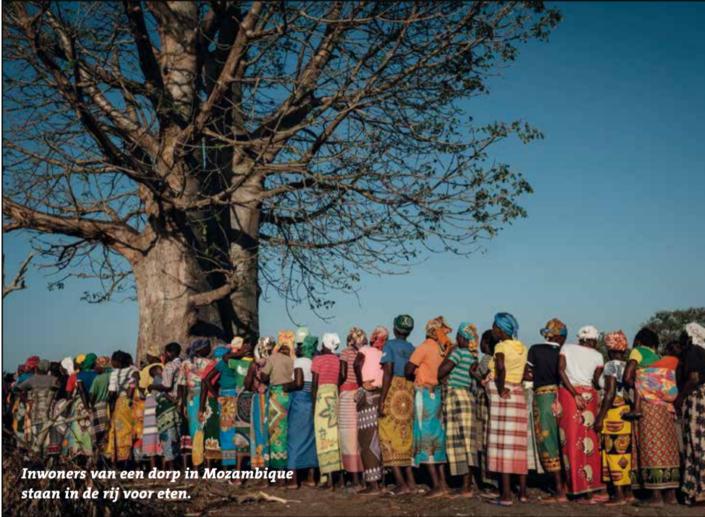
Inwoners van een dorp in Mozambique staan in de rij voor eten.