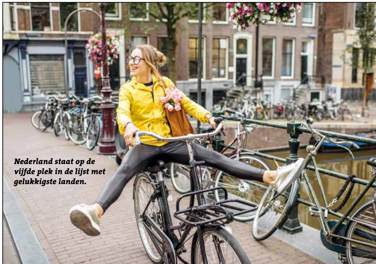
Nederland staat op de vijfde plek in de lijst met gelukkigste landen.

In totaal staan er 156 landen op de lijst. De lijst wordt opgesteld door de Verenigde Naties (VN). De VN kijkt naar belangrijke onderwerpen, zoals het verschil tussen rijk en arm in een land. En hoe goed het onderwijs in een land is, en de gezondheidszorg. Ze kijken ook naar hoe oud de inwoners van