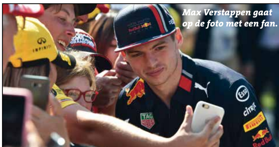
Max Verstappen gaat op de foto met een fan.