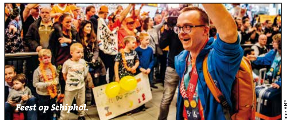
Feest op Schiphol.